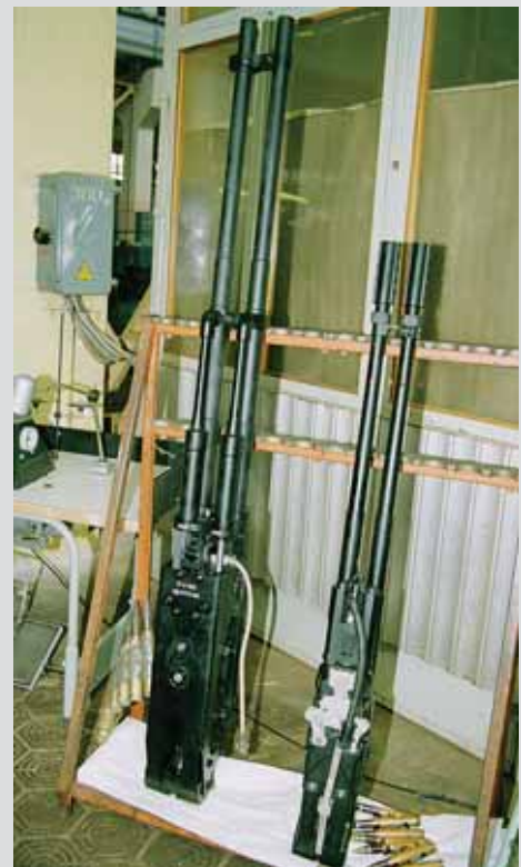
30-мм автоматическая пушка ГШ-30 (слева) и 23-мм автоматическая пушка ГШ-23

В.П. Грязев создал не только великолепные автоматические авиационные пушки. Он сделал прекрасные автоматы для сухопутных и морских зенитных комплексов. К тому же, все, что создавалось гением Василия Петровича, практически