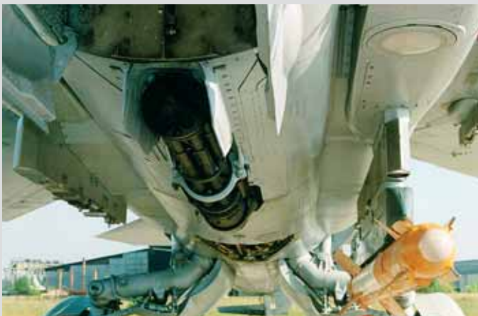
Шестиствольная 30-мм пушка ГШ-6-30 в составе системы вооружения истребителя-бомбардировщика МиГ-27

не имеет аналогов, не только в нашей стране, но и нигде в мире. Так, например, все многоствольные автоматические пушки зарубежного производства для привода их автоматики используют электрические приводы, потребляющие большое количество электроэнергии и не способные работать при отсутствии электросети. Пушки Грязева работают автономно. Ассортимент созданных им образцов не ограничивается только авиационными автоматическими пушками. Да, их много. Но есть у Великого конструктора-оружейника еще и созданные им образцы пистолетов, автоматов, снайперских винтовок, автоматических пушек для БМП (вертолетов, БТР, БМД), противотанковых управляемых ракетных комплексов.