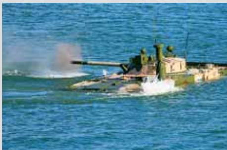
В составе комплекса вооружения БМП-3 две пушки конструкции В.П. Грязева: 30-мм 2А72 и 100-мм орудие-пусковая установка 2А70

Сегодня образцы оружия, созданные творческим тандемом «ГШ» (Грязев-Шипунов) прочно прописаны в арсеналах Вооруженных сил России и не только.