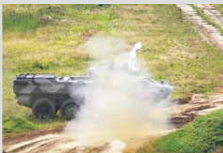
Пуск ракеты противотанкового ракетного комплекса «Корнет-Э»