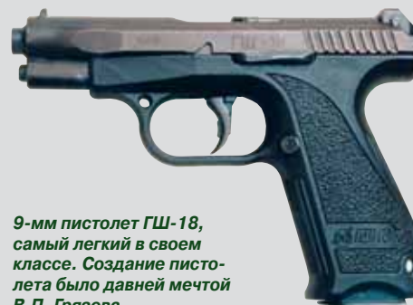
9-мм пистолет ГШ-18, самый легкий в своем классе. Создание пистолета было давней мечтой В.П. Грязева

насчитало в нем 56 деталей, и было приказано сделать пистолет, в котором деталей будет вдвое меньше. Действительно, в Р38 их 28. В.П. Грязев и А.Г. Шипунов последовали этому примеру. Отечественный ГШ-18 тоже состоит из 28 деталей, но весит почти вдвое меньше, его масса без магазина составляет 490 грамм. Ни один пистолет этого класса в мире не достиг такой малой величины!