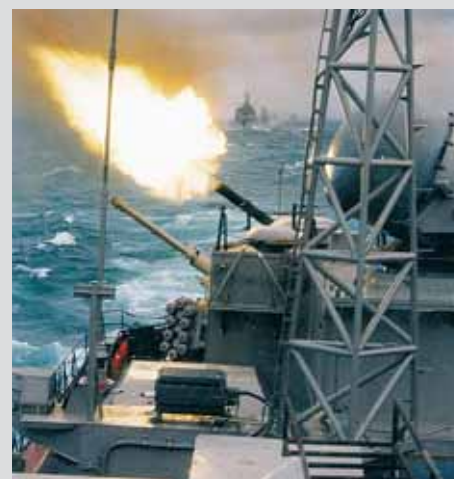
Огонь ведет корабельный артиллерийский комплекс АК-630 с 30-мм пушкой ГШ-6-30К

насчитало в нем 56 деталей, и было приказано сделать пистолет, в котором деталей будет вдвое меньше. Действительно, в Р38 их 28. В.П. Грязев и А.Г. Шипунов последовали этому примеру. Отечественный ГШ-18 тоже состоит из 28 деталей, но весит почти вдвое меньше, его масса без магазина составляет 490 грамм. Ни один пистолет этого класса в мире не достиг такой малой величины!