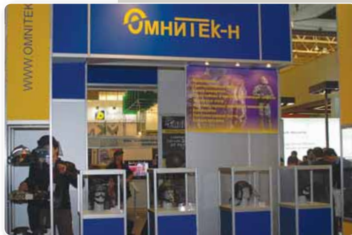
Продукция компании «Омнитек-Н» пользуется широким спросом у представителей спецподразделений МВД

The Military Industrial Company unveiled the SPM-3 special vehicle