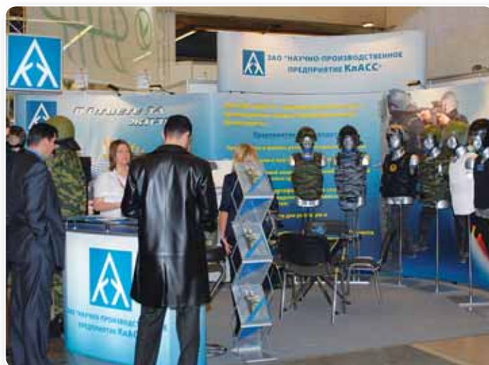
Много внимания участниками выставки уделялось средствам индивидуальной защиты

The Strela joint stock company displayed a wide range of electronic intelligence devices that could be used in the fight against terrorism