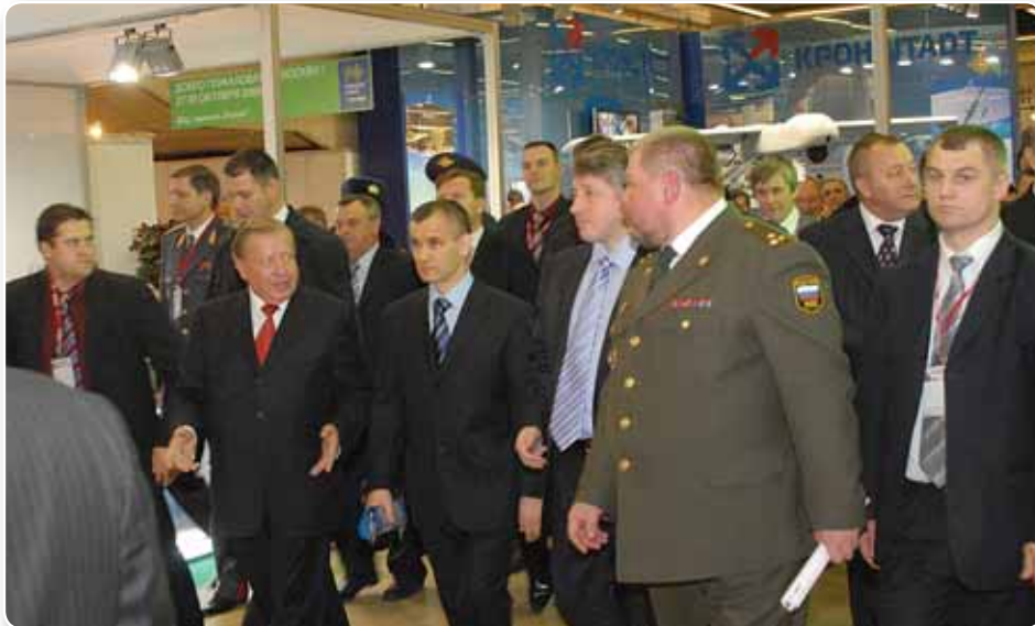
Руководство Министерства внутренних дел Российской Федерации во главе с министром внутренних дел РФ генералом армии Рашидом Нургалиевым осматривают экспозицию выставки «Интерполитех-2008»

Top officials of the Russian Ministry of Interior, led by the minister, General of the Army Rashid Nurgaliyev, are examining the exposition of the Interpolitech 2008 exhibition