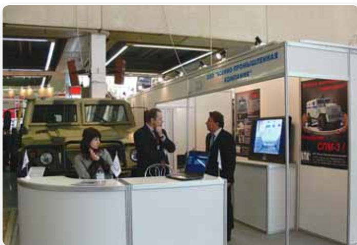
ООО «Военно-промышленная компания» представила новинку – специальное транспортное средство СПМ-3»

Since many security aids are military applications, their number on display was considerable too. According to Vladimir Paleschuk, deputy director of the Federal Military Technical Cooperation Service, Russia alone exhibited over 500 examples of military gear at the show. 22 of the 239 Russian