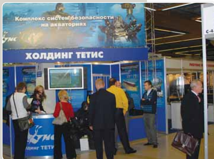
Холдинг «Тетис» представил комплекс систем обеспечения безопасности на акваториях

The Tetis holding company exhibited a set of reservoir security systems