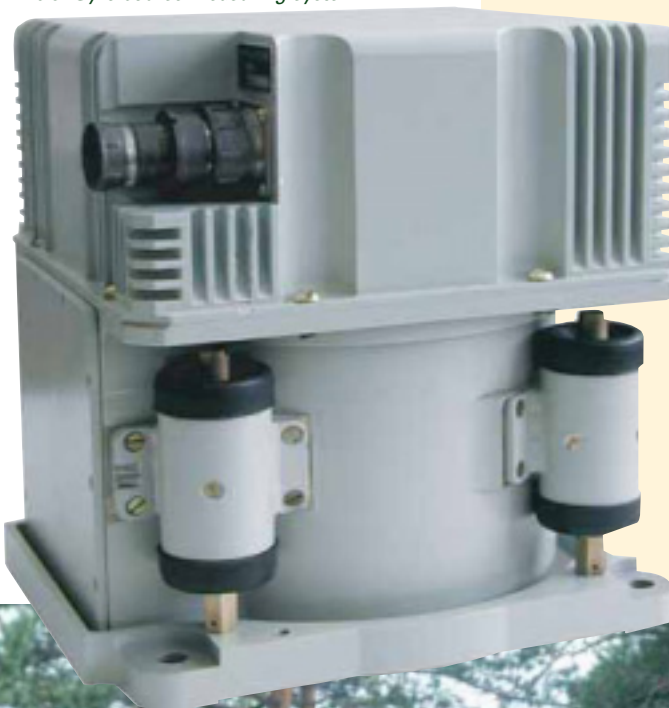
Рис.3. Gyro course measuring system