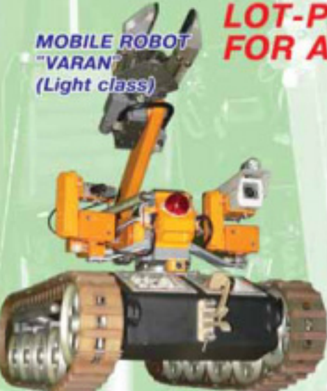
MOBILE ROBOT "VARAN" (Light class)