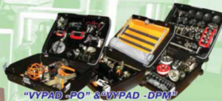
"VYPAD-PO" & "VYPAD-DPM" Sets of appliances for remote operation with explosion-hazardous items.