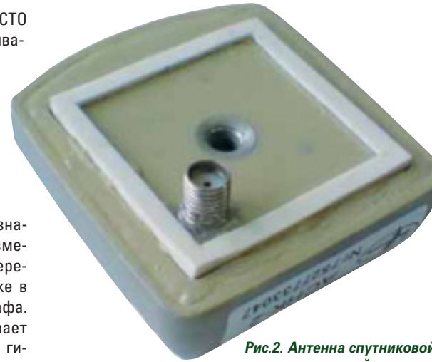
Рис.2. Антенна спутниковой навигационной системы

Координатор предназначен для коррекции путевой информации, вводимой в счетно-решающее устройство, разложения пройденного объектом пути на составляющие коор-