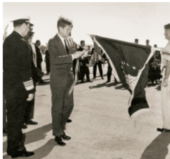
Президент Джон Ф. Кеннеди прикрепляет почетную ленту на знамя 363-го тактического разведывательного авиакрыла за заслуги во время кубинского кризиса