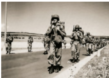
Прицельные комплексы произведенные Прицельные комплексы произведе

Нутром чувствую: третий залп машину разнесет. Резко даю газ, сворачиваю в переулок, прикрываясь избами. Немцы увлек-