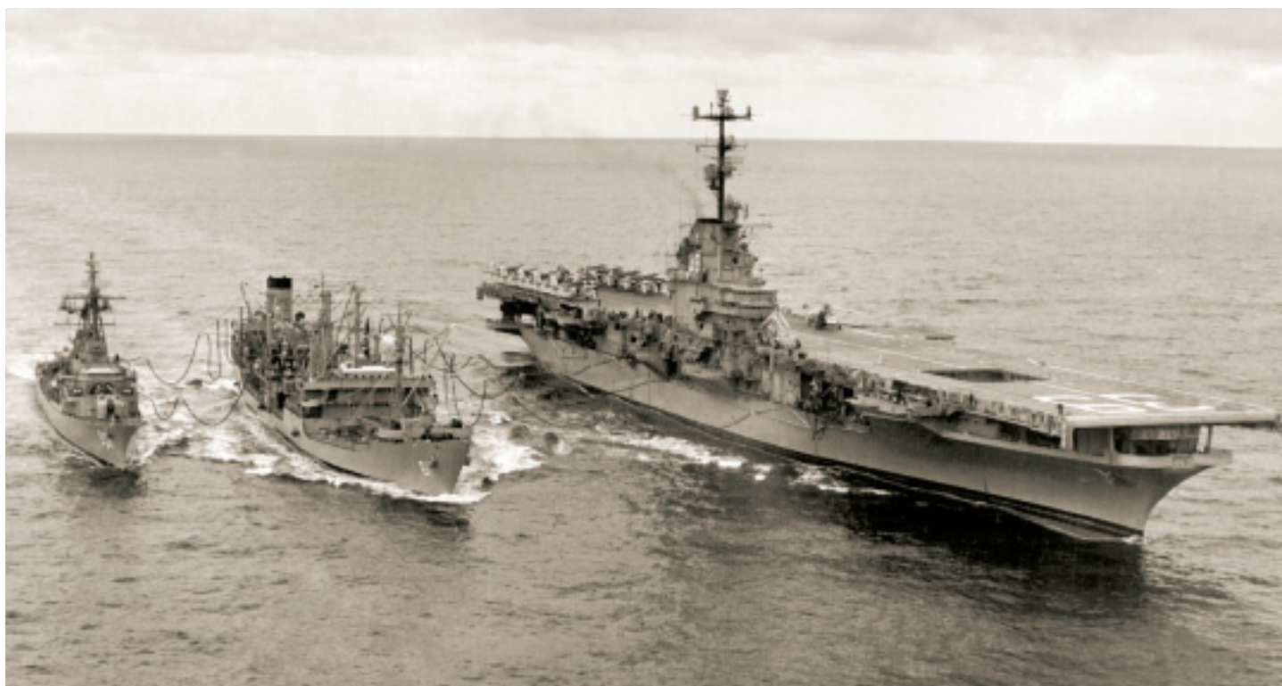
Прицельные комплексы произведенные на ОАО «РОМЗ» прошли жесткие испытания в различных климатических условиях Прицельные комплексы произведенные на ОАО «РОМЗ» прошли жесткие испытания в различных климатических условиях

Анатолий Иванович, с Фиделем Кастро Вас связывает личная дружба. Сильно ли обижены кубинцы на нас за то, что мы без их согласия вернули тогда ракеты с Кубы, в 90-е закрыли станцию слежения и, по существу, бросили самого преданного за последние 50 лет нашего союзника?