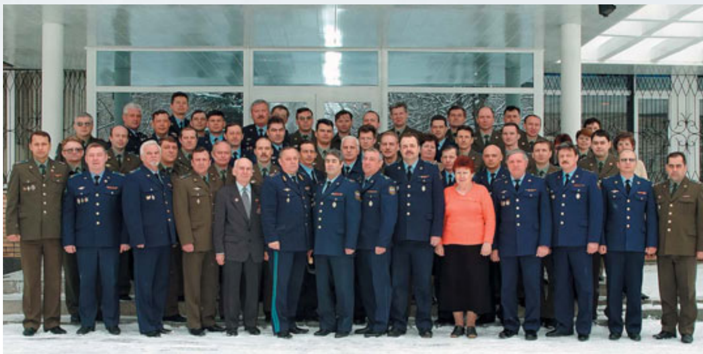
Оперативное управление главного штаба ВВС.