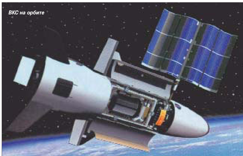
ВКС на орбите

К наиболее сложным техническим проблемам создания гиперзвуковых самолетов тяжелого класса относят разработку высокоэффективных двигательных установок, новых конструкционных материалов и «всепогодных» теплозащитных покрытий, обеспечение высокой надежности и «отказоустойчивости» бортовых систем (более подробно о создании гиперзвуковых технологий в рамках проекта Hyper-X говорилось в «АКО» № 5 2003 г.).