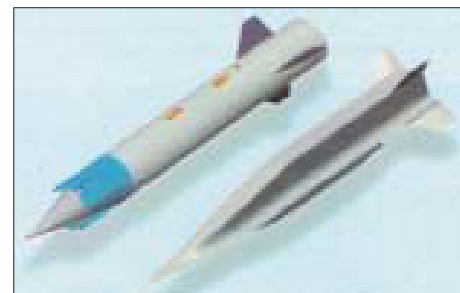
Конкурсные предложения по программе ARRMD: ракета с двухрежимным ПВРД (слева) и ракета с СПВРД HyTech.

Военно-морское ведомство также ведет НИОКР по гиперзвуковым ракетам. В середине 90-х годов после ряда концептуальных исследований ВМС сформулировали общие