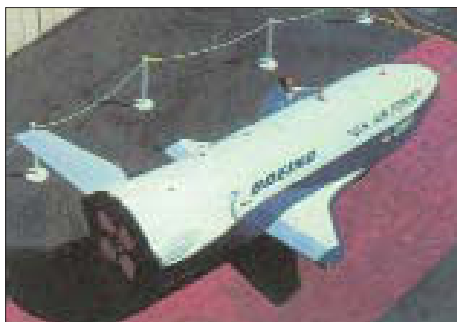
Опытная модель аппарата SMV.

может достичь года, трансатмосферный аппарат SMV в автоматическом режиме возвратится на Землю.