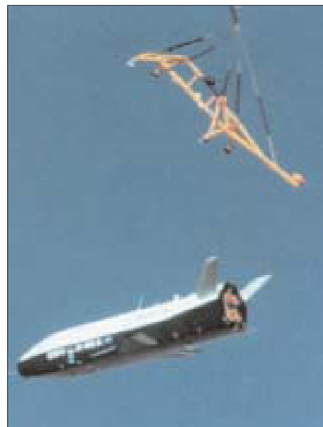
Отценка аппарата X-40A.

Перед очередным этапом испытаний повышенной сложности модель модернизированной