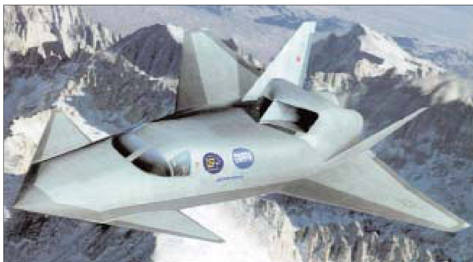
Один из проектов высокоскоростного самолета QSP.

Значительную часть полученных по контракту средств (43 млн. долл.) корпорация Boeing передала фирме Aerojet за поставку двигателей для ракеты HyFly. Объем заказа составил 14 изделий, шесть из которых предназначены для стендовой отработки. В связи с жесткими ограничениями габаритов маршевый двигатель полностью интегрирован с цилиндрическим корпусом ракеты. ПВРД, работающий на углеводородном горючем JP-10, оснащен цилиндрическим шестисекционным воздухозаборником, два канала которого направляют воздух в центральную дозвуковую камеру. Остальные обеспечивают за этой камерой периферийное сверхзвуковое горение.