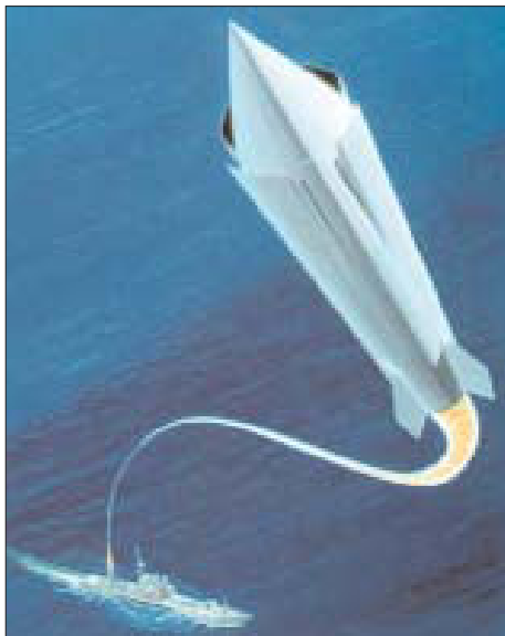
Запуск ракеты HyFly с корабля.

требования к перспективным образцам вооружения: дальность действия - 1100 км, скорость полета M=3,5-7 , проникающая способность - 5,4-11 м железобетона, принятие на вооружение – в 2006-2010 гг.