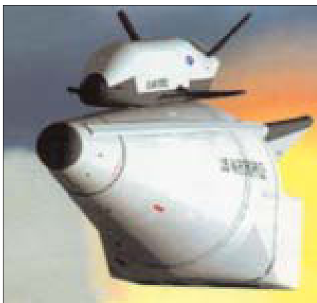
Разгонная ступень SOV с аппаратом SMV на борту.