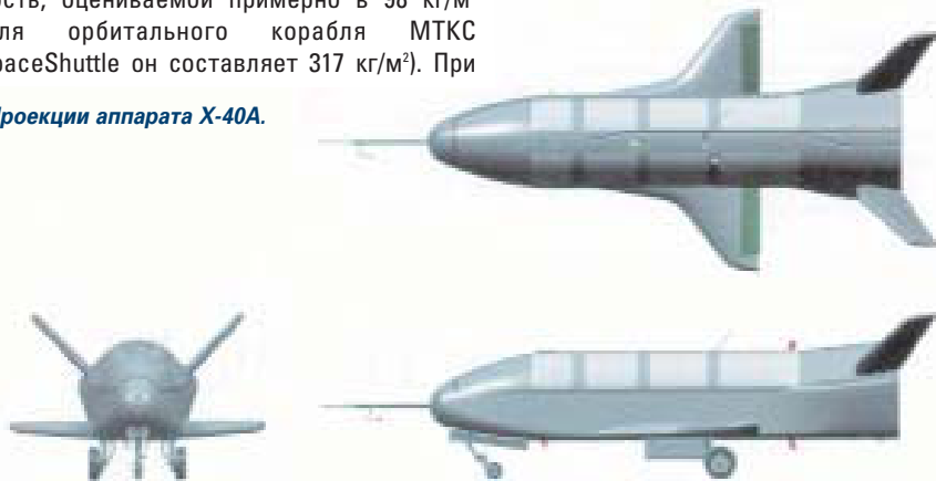
Проекция аппарата X-40A.

таких показателях тормозить аппарат будет быстро, и продолжительность полета на глассаде выравнивания не превысит 1 с (время прохождения внутренней глассады корабля МТКС достигает 5 с, посадочная скорость - 350-360 км/ч). В связи с этим для снижения ударных нагрузок при посадке аппарата SMV на скорости 270-280 км/ч необходимо высокоэффективное управление моментом инерции изделия.