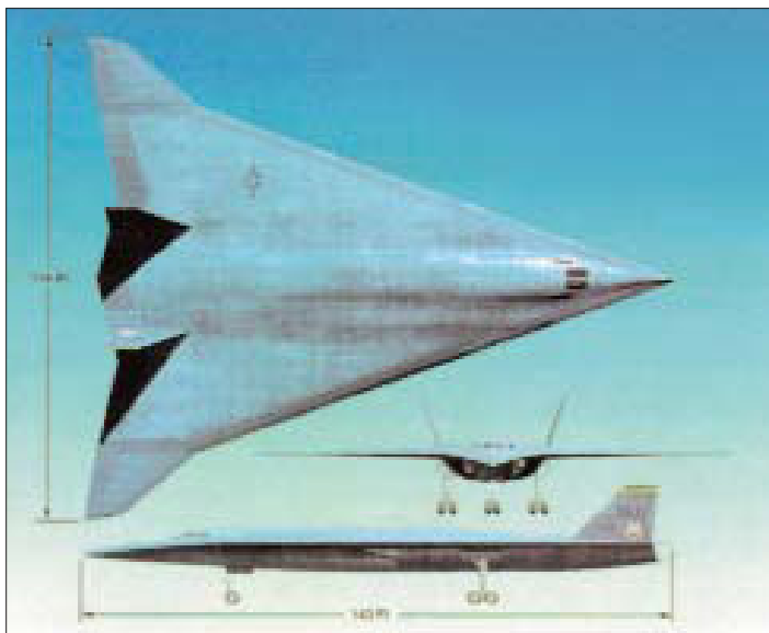
Проекты сверхзвукового и гиперзвукового (внизу) бомбардировщиков фирмы Northrop Grumman.