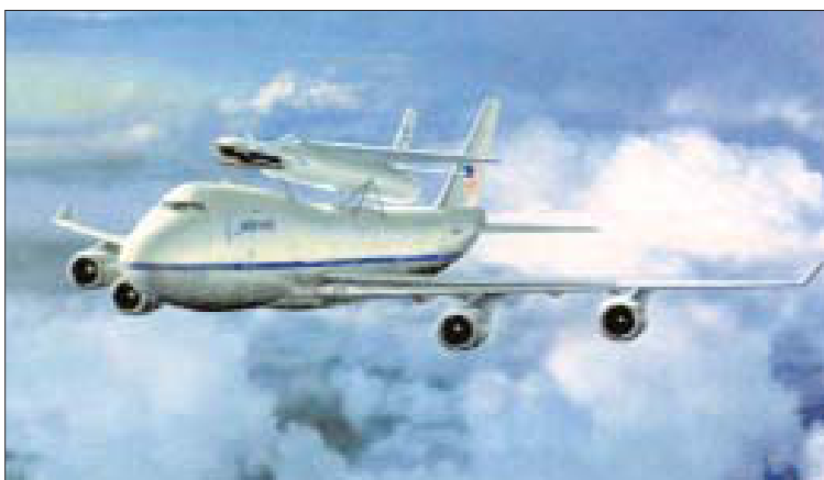
Авиационно-космическая система AirLaunch