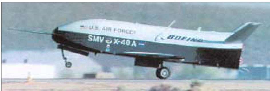
Приземление аппарата X-40A.

Практические данные об условиях гиперзвукового полета перспективных ВКС после схода с орбиты военные планируют получить в ходе испытаний модели X-37 в 2006 г. По их результатам, вероятно, окончательно решат – разрабатывать ли аппарат SMV? В то же время, учитывая значимость в ВВС трансатмосферных ракетопланов, не исключено форсирование работ по этому проекту за счет дополнительных средств из военного бюджета.