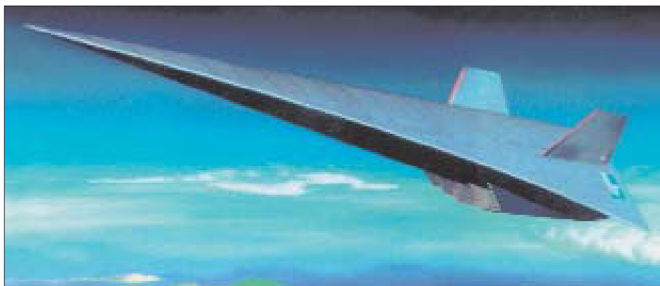
Гиперзвуковой аппарат HyperSoar.

В последнее время подобным возможностям придают все большее значение, так как изменение политической ситуации в мире вынуждает США сокращать число своих зарубежных баз. При этом аналитики отмечают постоянно возрастающую военную мощь ряда государств (в первую очередь, Китая), которая снижает эффективность применения авианесущих группировок по крайней мере в Азиатско-Тихоокеанском регионе.