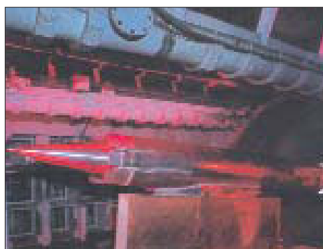
Модель ракеты HyFly на испытательном стенде.

Ударную систему HyFly проектируют в двух модификациях - морского базирования (на надводных кораблях и подлодках) и воздушного старта с самолетов F-18. В первом случае ее длина вместе с разгонным блоком составит 6,5 м, стартовая масса - 1,72 т, а дальность действия - 1100 км; для второго варианта эти параметры определяются 4,65 м, 1 т и 720 км соответственно. Ракету HyFly оснастят системой наведения по сигналам со спутников Nawstar. Кроме того, предусматривается и канал радиосвязи для оперативного изменения полетного задания после запуска изделия.